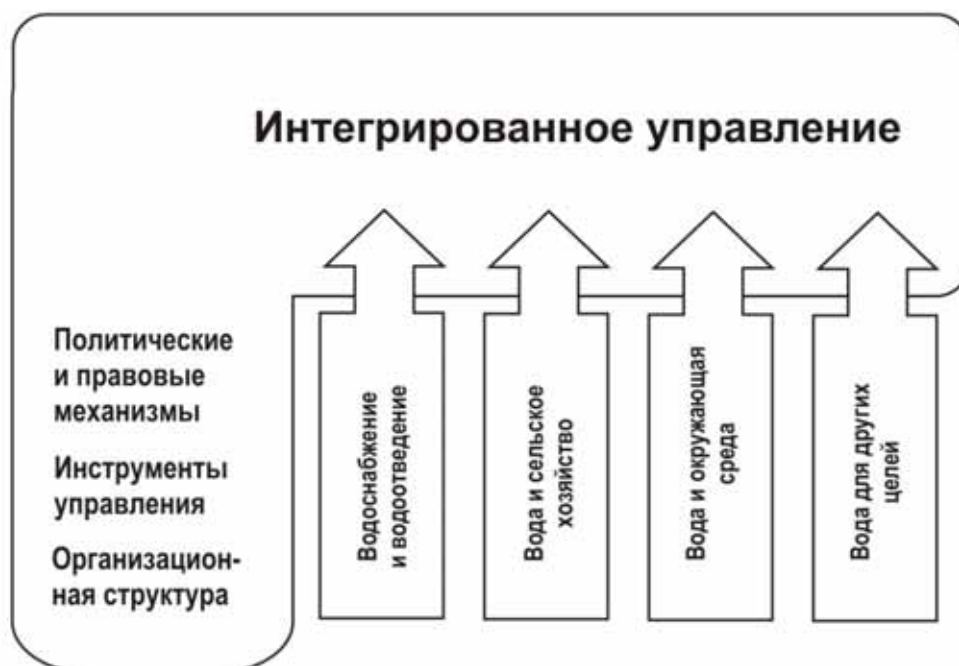
Рисунок 1: Схема ИУВР, предложенная Глобальным водным партнёрством, 2002

65. ИУВР основано на следующих принципах: